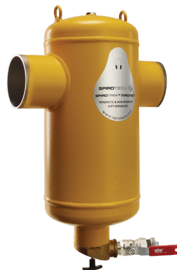
Image du produit