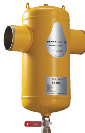
Image du produit