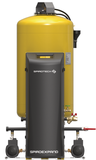
Image du produit