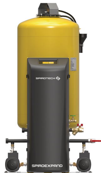
Image du produit