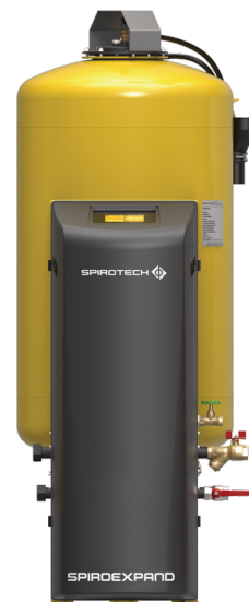
Image du produit