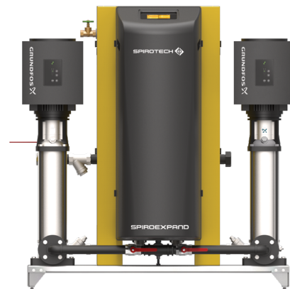
Image du produit