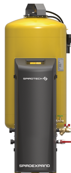
Image du produit