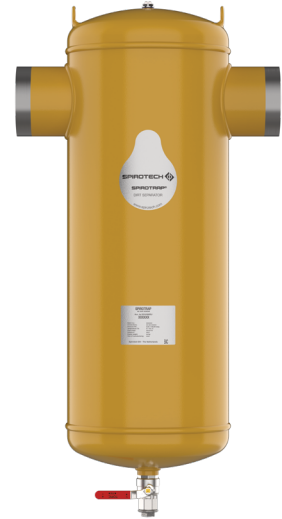
Image du produit