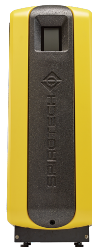
Image du produit